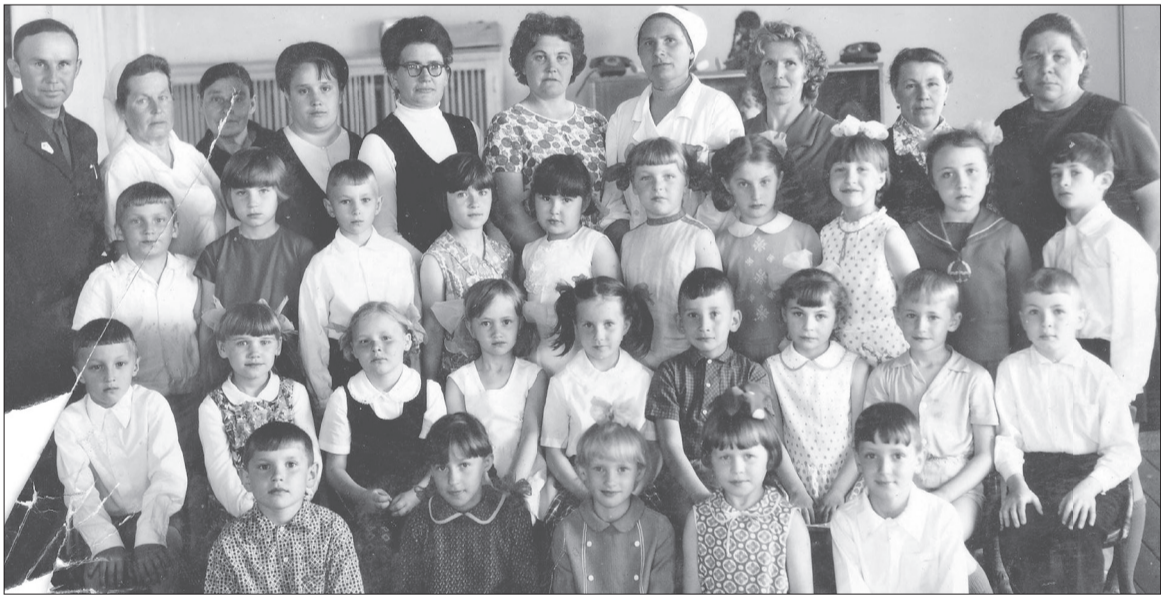
Детский сад «Солнышко», 1970-е годы