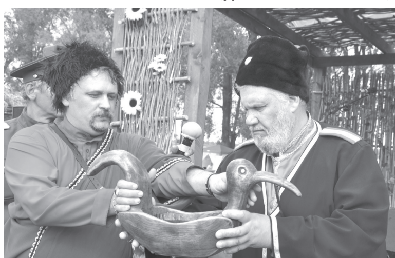
Пошла братина по кругу